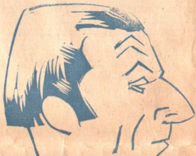
Ecco qui Peppin dottore, degli uccelli uccellatore, che goliardo serba il core.

Lui griderà di vedere le stelle, non credetegli, mettetelo alla porta senza un soldo.