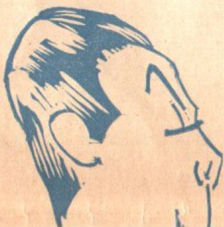
Ecco qui Giogìò l'alpino, fresco, bello e tenerino.

Ma perchè delle immagini così? Se anche lei..... perchè pensarci sopra proprio ora che se